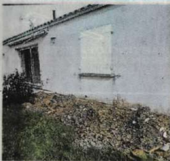
Un drain devait être posé le long de ce mur humide. Rien n'a été fait, seulement un trou.